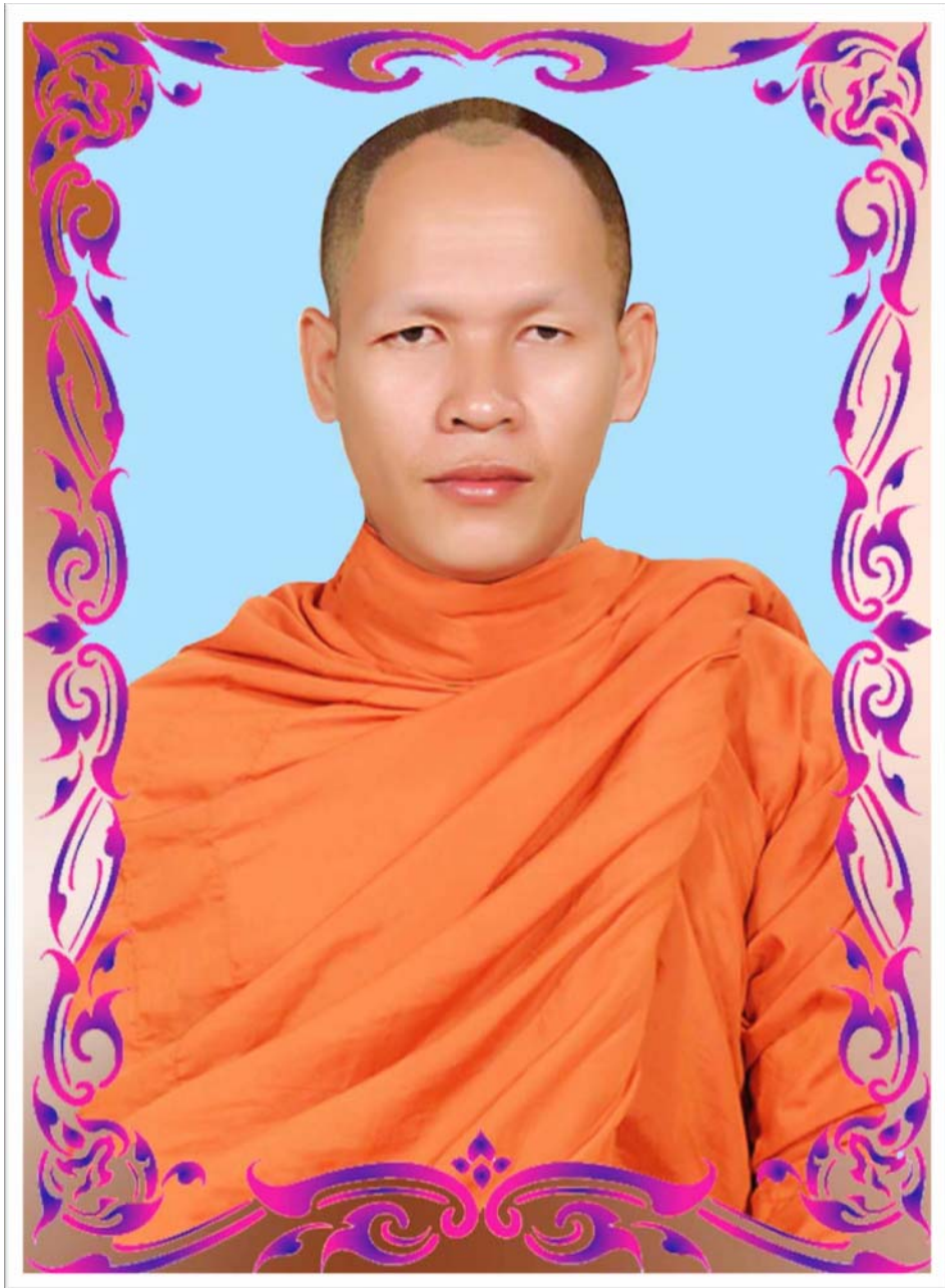
ពិភ័យ អគ្គបិណ្ឌ គង់សុមិត្ត